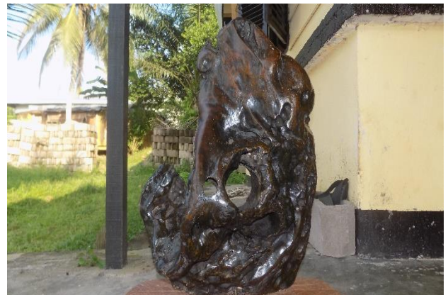
Bois de flotte poli (CETADEK)