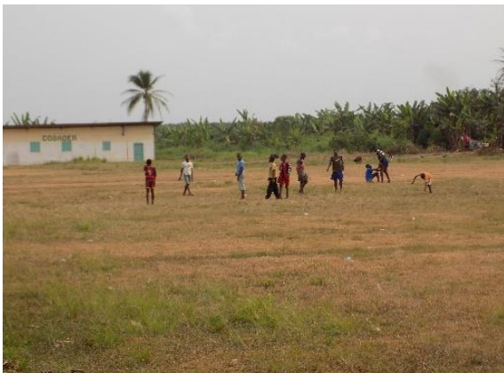
Une vue du mythique stade et du palmerais de DIZANGUE