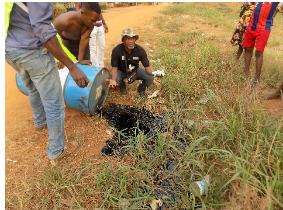
Huiles usées déversées en plein nature à la merci des bêtes et enfants.

AFAIRD: BP 35104 Yaoundé-Cameroun. Tél. : (+237) 699 81 80 24/ 676 52 91 69/678 64 48 24