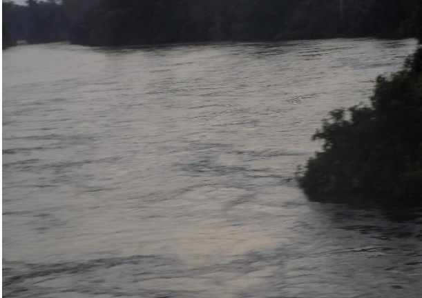
Une vue du fleuve LOKUNDJE